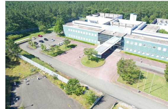
総合食品研究センター全景